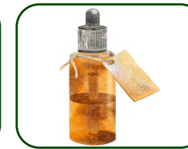
Huiles essentielle végétales